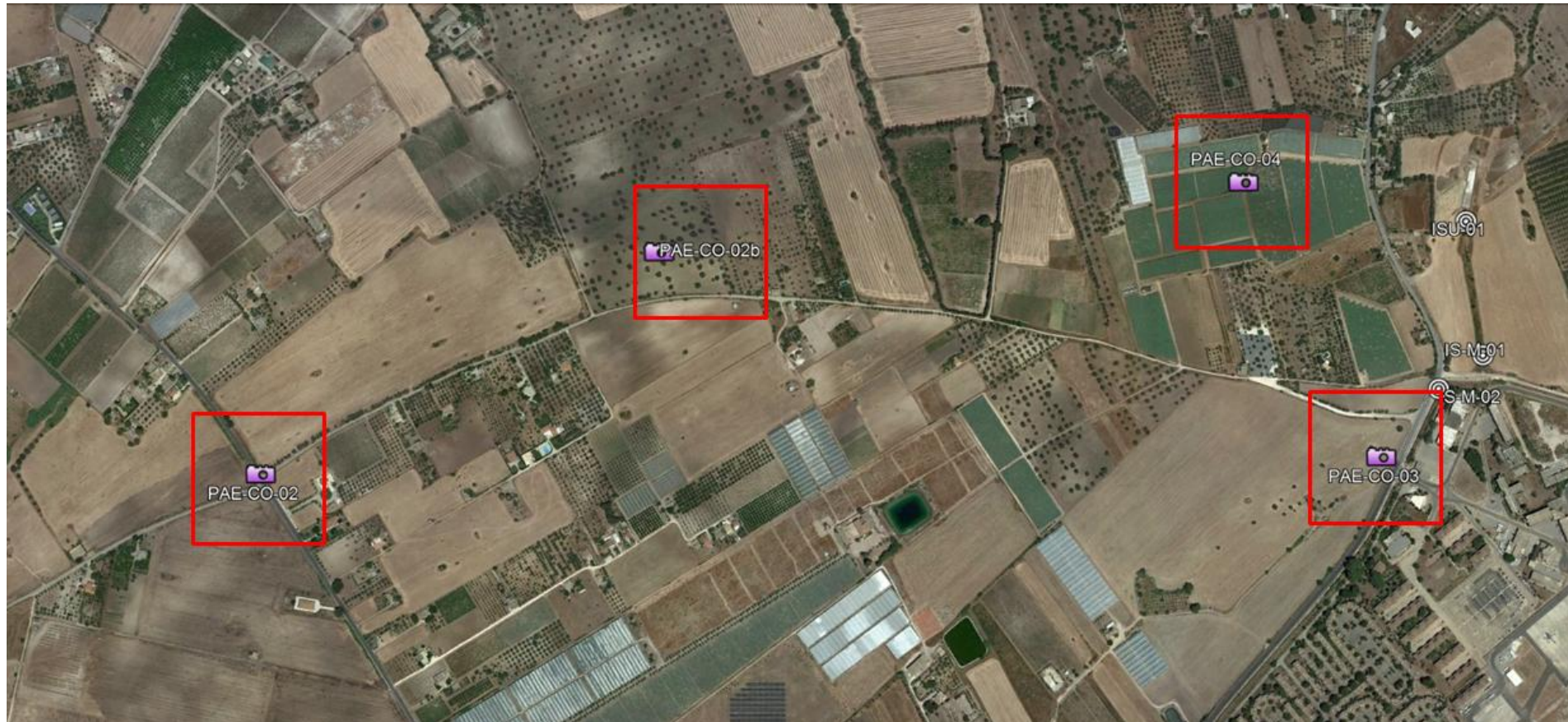
Figura 2. . Stralcio Ortofoto con individuazione dei punti di monitoraggio della componente paesaggio